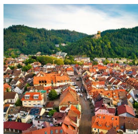
Marktplatz Waldkirch mit Sicht auf Kastelburg