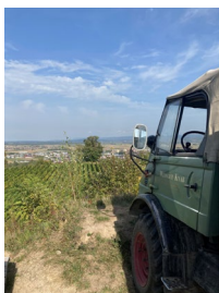
Unimogtour Weingut Knab Endingen, © Stadt Endingen