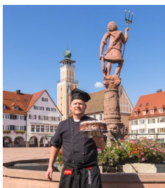
Kirschtortenbäcker in Freudenstadt

Laden Sie sich hier die passenden Fotos zu den einzelnen Programmpunkten dieses Reisevorschlags herunter: https://tourismus-bw.canto.com/b/OGT6H . Wir bitten um Angabe der Copyrights und Urheberrechte.