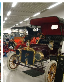
ErfinderZeiten-Museum in Schramberg