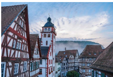
Rathaus von Mosbach

Digitale Stadtführungen: Alle 20 Kleinstadtperlen können Sie mit der App "zeigmal" digital entdecken. Audio- und Textinformationen sowie Augmented-Reality-Stationen sind darin enthalten. App kostenfrei und ohne Registrierung im App Store auf das Smartphone herunterladen: www.zeigmal.digital