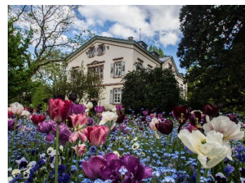
Tulpenblüte im Schau- und Sichtungsgarten Hermannshof in Weinheim