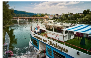
Schiffahrt auf dem Hochrhein