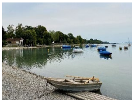
Radolfzell am Bodensee

Digitale Stadtführungen: Alle 20 Kleinstadtperlen können Sie mit der App "zeigmal" digital entdecken. Audio- und Textinformationen sowie Augmented-Reality-Stationen sind darin enthalten. App kostenfrei und ohne Registrierung im App Store auf das Smartphone herunterladen: www.zeigmal.digital