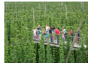
Hopfensteg des Hopfenguts No. 20 in Tett nang