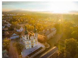
Residenzbereich in Donaueschingen, © Stadt Donaueschingen, Foto: Tobias Raphael Ackermann