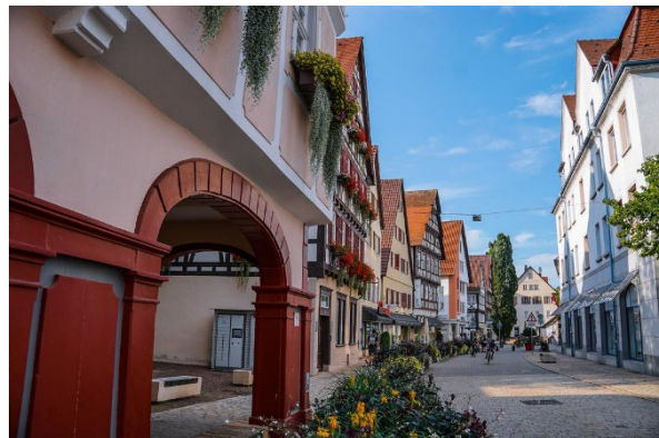
Altstadt der Kleinstadtperle Nagold