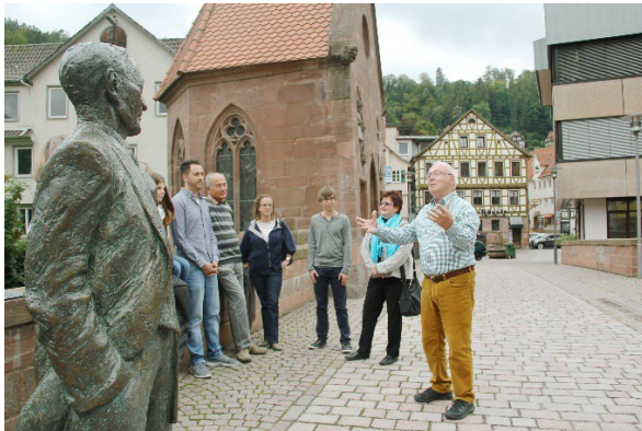
Führung "Auf den Spuren von Hermann Hesse" in Calw

Digitale Stadtführungen: Alle 20 Kleinstadtperlen können Sie mit der App "zeigmal" digital entdecken. Audio- und Textinformationen sowie Augmented-Reality-Stationen sind darin enthalten. App kostenfrei und ohne Registrierung im App Store auf das Smartphone herunterladen: www.zeigmal.digital