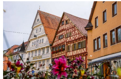
Marktstraße in der Altstadt von Nagold, © Foto: Lena Martin