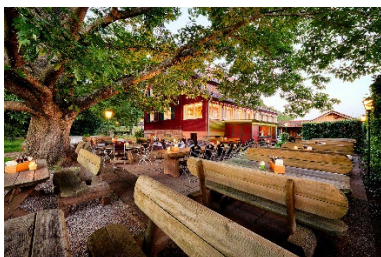
Restaurant Wanderheim Zavelstein in der Nähe von Calw

Digitale Stadtführungen: Alle 20 Kleinstadtperlen können Sie mit der App “zeigmal” digital entdecken. Audio- und Textinformationen sowie Augmented-Reality-Stationen sind darin enthalten. App kostenfrei und ohne Registrierung im App Store auf das Smartphone herunterladen: www.zeigmal.digital