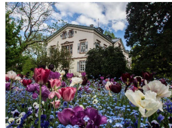
Tulpenblüte im Schau- und Sichtungsgarten Hermannshof in Weinheim, © Foto Gunnar Fuchs