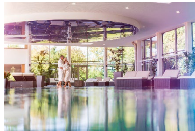
Solymar-Therme in Bad Mergentheim