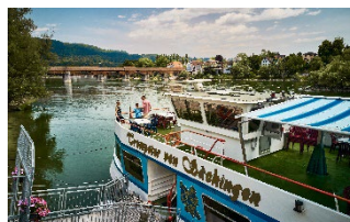
Schiffahrt auf dem Hochrhein