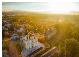
Residenzbereich in Donaueschingen