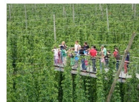
Hopfensteg des Hopfenguts No. 20 in Tett nang