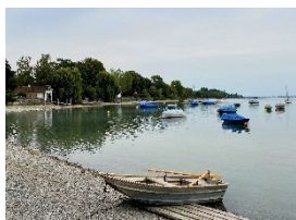
Radolfzell am Bodensee

Digitale Stadtführungen: Alle 20 Kleinstadtperlen können Sie mit der App "zeigmal" digital entdecken. Audio- und Textinformationen sowie Augmented-Reality-Stationen sind darin enthalten. App kostenfrei und ohne Registrierung im App Store auf das Smartphone herunterladen: www.zeigmal.digital